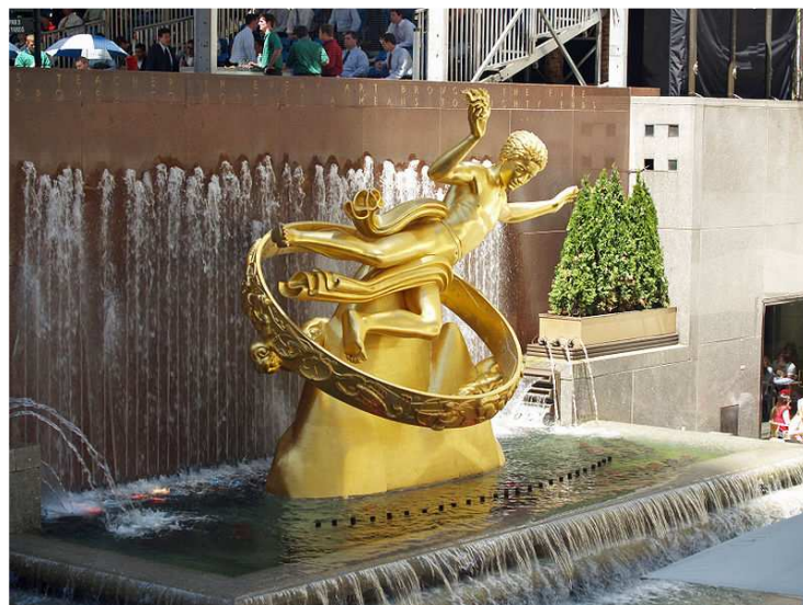
Sculpture of Prometheus in front of the GE Building at the Rockefeller Center (New York City, New York, United States).